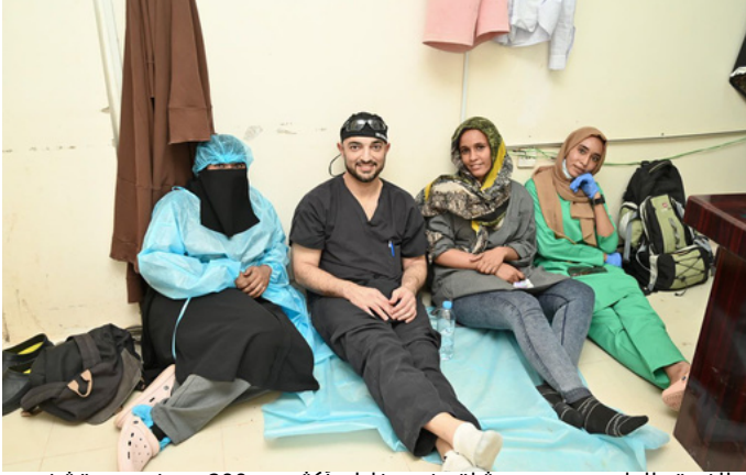
الفريق الطبي بعد يوم شاق خدم خلاله أكثر من 200 مريض بمستشفى سابا للنازحين - مستشفى سابا للنازحين، مدني، ولاية الجزيرة