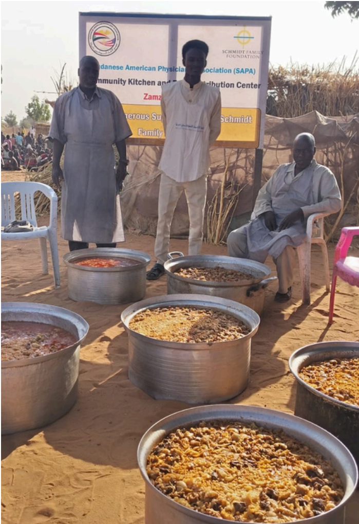
مطبخ سابا بمعسكر زمزم في شمال دارفور قبل اجتياح المعسكر