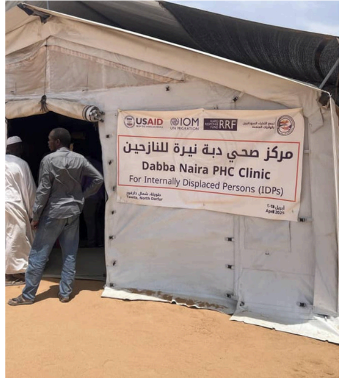
طويلة، شمال دارفور - مركز دبة نيرة الصحي للنازحين، الذي تُشغله سابا بالشراكة مع صندوق الاستجابة السريعة التابع للمنظمة الدولية للهجرة (IOM) وبدعم من الوكالة الأمريكية للتنمية الدولية (USAID).

يهدف المشروع لتقديم الخدمات الصحية لأكثر من 11,000 شخص بشكل مباشر، والوصول إلى أكثر من 89,000 مستفيد غير مباشر في 30 قرية من القرى النائية بشمال دارفور.