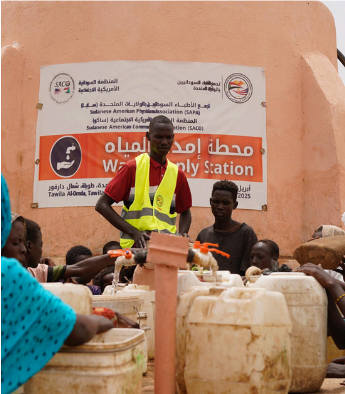
مضخة المياه الصالحة للشرب بدعم من سابا وساكو في منطقة طويلة، شمال دارفور.