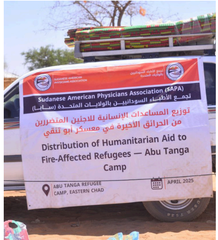
حريق "أبو تنقي": معاناة جديدة

تستضيف تشاد أعداداً كبيرة من اللاجئين السودانيين، إلا أن اللجوء لم يُمثل طوق نجاة لهم، بقدر ما كان انتقالاً إلى معاناة من نوع آخر، إذ وجد اللاجئون أنفسهم وسط نقص حاد في الموارد والخدمات. وقد زاد من خطورة الوضع تراجع التمويل الإنساني، مما أدى إلى تقليص أو توقف بعض الخدمات الحيوية كالرعاية الصحية والتعليم.