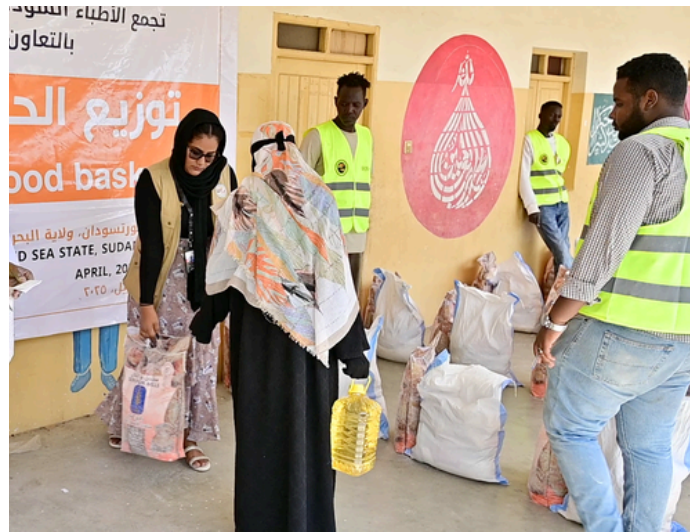
توزيع سلال غذائية بمخيمات النازحين ضمن بعثة قودا في بورتسودان، ولاية البحر الأحمر.