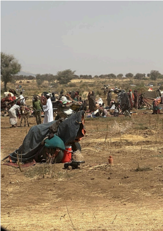
الأسر النازحة من معسكر زمزم إلى طويلة يصلون دون خيام ويبيتون في العراء.

ويشمل هذا التدخل تأهيل المرافق الصحية في المناطق المستهدفة لضمان استمرارية الخدمات الطبية وتحسين بيئة تقديم الرعاية الصحية، بإنشاء 4 عيادات ثابتة وتشغيل 3 وحدات صحية متنقلة.