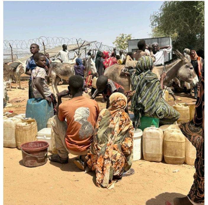
صف من النازحين، أغلبهم من معسكر زمزم، ينتظرون الحصول على مياه صالحة للشرب في منطقة طويلة، شمال دارفور.