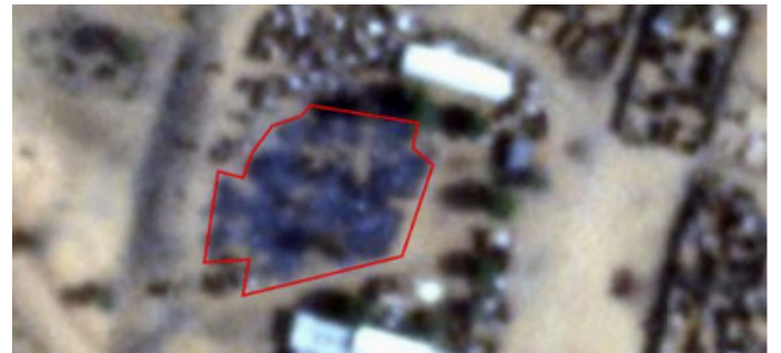
صورة توضح آثار الحريق على هياكل مطبخ سابا بمعسكر زمزم، نتيجة حريق وقع بين 11 و14 أبريل 2025، وفقاً لتحليل مختبر البحوث الإنسانية بجامعة بيل.

وقد تعرض مطبخ سابا، الذي قدم أكثر من 630,000 وجبة منذ أغسطس 2024 في إطار مشروع الأمن الغذائي، للقصف المباشر واحتراقه، كما وثقت صور الأقمار الصناعية الصادرة عن مختبر البحوث الإنسانية بجامعة بيل الأمريكية. كما تعرض مركز واحة الأمل للأطفال للتدمير الكامل.