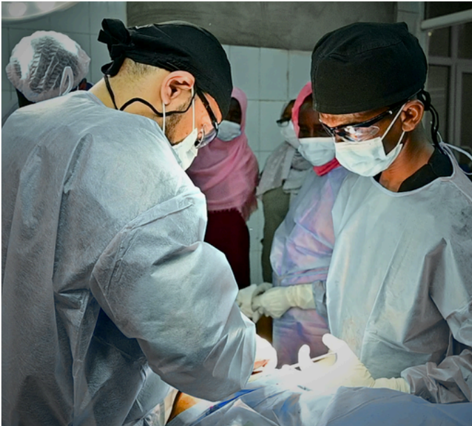
جانب من العملية الجراحية المجانية بمستشفى سابا للنازحين في مدني، ولاية الجزيرة.

ومن ضمن الأنشطة التي نفذتها البعثة، انتقالها الى ولاية البحر الأحمر، مدينة بورتسودان، حيث تم توزيع 480 سلة غذائية للأسر النازحة الأكثر احتياجاً داخل مراكز الإيواء المختلفة.